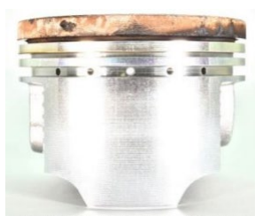
PROPULS COMPETITION 4T 15W-60