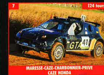
7 MARESSÉ-CAZE-CHARBONNIER-PRIVE CAZE HONDA