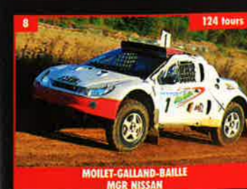
8 MOILLET-GALLAND-BAILLE MGR NISSAN