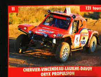
11 CHERVIER-VINCENDEAU-LAURHE-DAVOY ORYX PROPULSION

— Catégorie T1A — Catégorie T1B — Catégorie T2