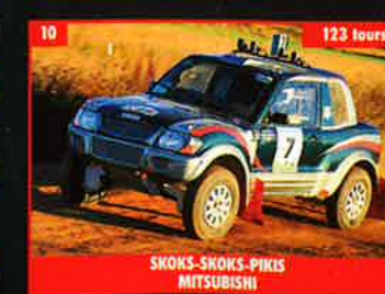
10 SKOKS-SKOKS-PIKIS SKOKS MITSUBISHI