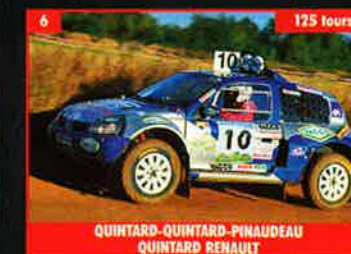
6 QUINTARD-QUINTARD-PINAUDEAU QUINTARD RENAULT