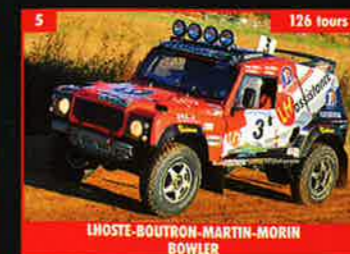
5 LHOSTÉ-BOUTRON-MARTIN-MORIN BOWLER