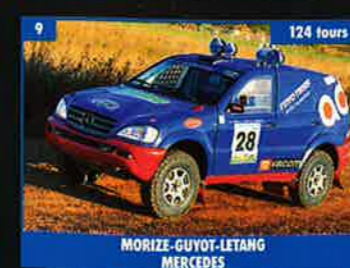
9 MORIZE-GUYOT-LETANG MORIZE MERCEDES