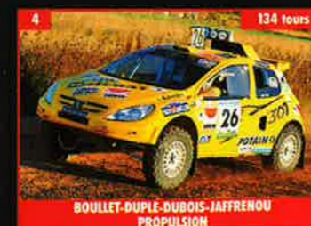
4 BOULLET-DUPLÉ-DUBOIS-JAFFRENOU PROPULSION